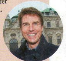
Tom Cruise erwies sich als Freund der Wiener Rindfleisch-Küche und Bier

Ja, auch ich bin zweimal im Mission: Impossible 5 -verursachten Stau gestanden und habe heimlich über Film, Star und Aufwand in mich reingeflücht. Aber dann wurde mir folgendes Anekdotchen erzählt – und ich bin versöhnt: Cruise besuchte samt Crew (insgesamt 20 Leute) ein bekanntes Innenstadrestaurant und erwies sich dort zum Personal als absolut netter Charnebolzen. Keine Extrawürsteln (nur die Bitte, das Lokal diskret durch einen Hintereingang betreten und wieder verlassen zu dürfen), großes Interesse an Wiener Rindfleisch-Spezialitäten sowie heimischen Biermaßen. Er dachte nämlich, ein Seidel (0,3 Liter) sei schon ein großes Bier, weil er ein kleines wollte. Er ließ sich alles erklären, lachte viel – und am Ende gab es ein fettes Trinkgeld für das vom Star angenehm überraschte Personal. Kommen Sie wieder!